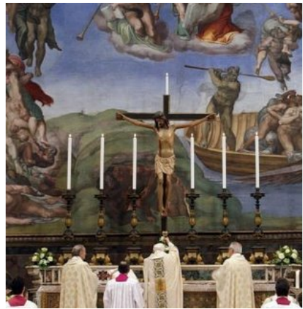
▲ Paus Benedictus XVI celebreert de Mis 'versus crucem' in de Sixtijnse Kapel